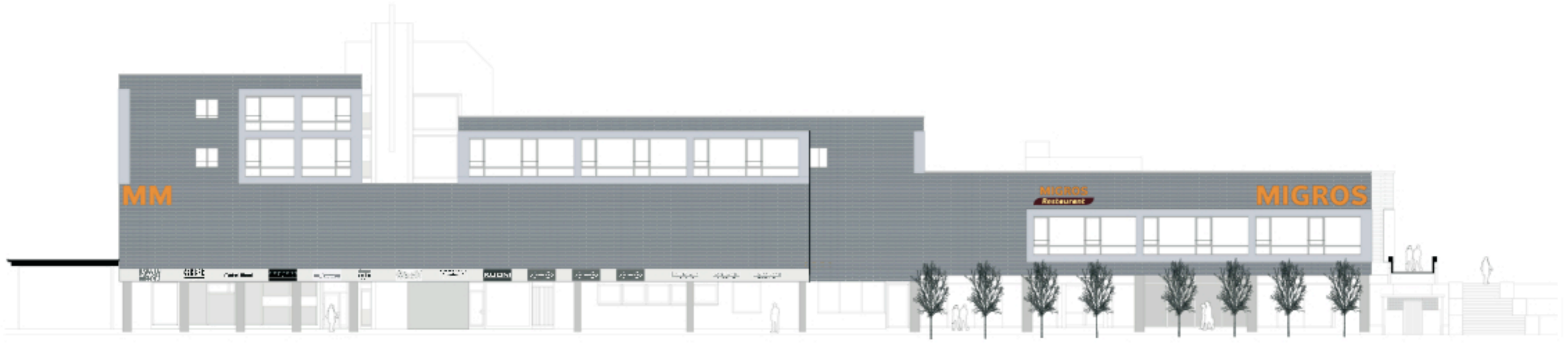
Fassade Nord - West 1:500